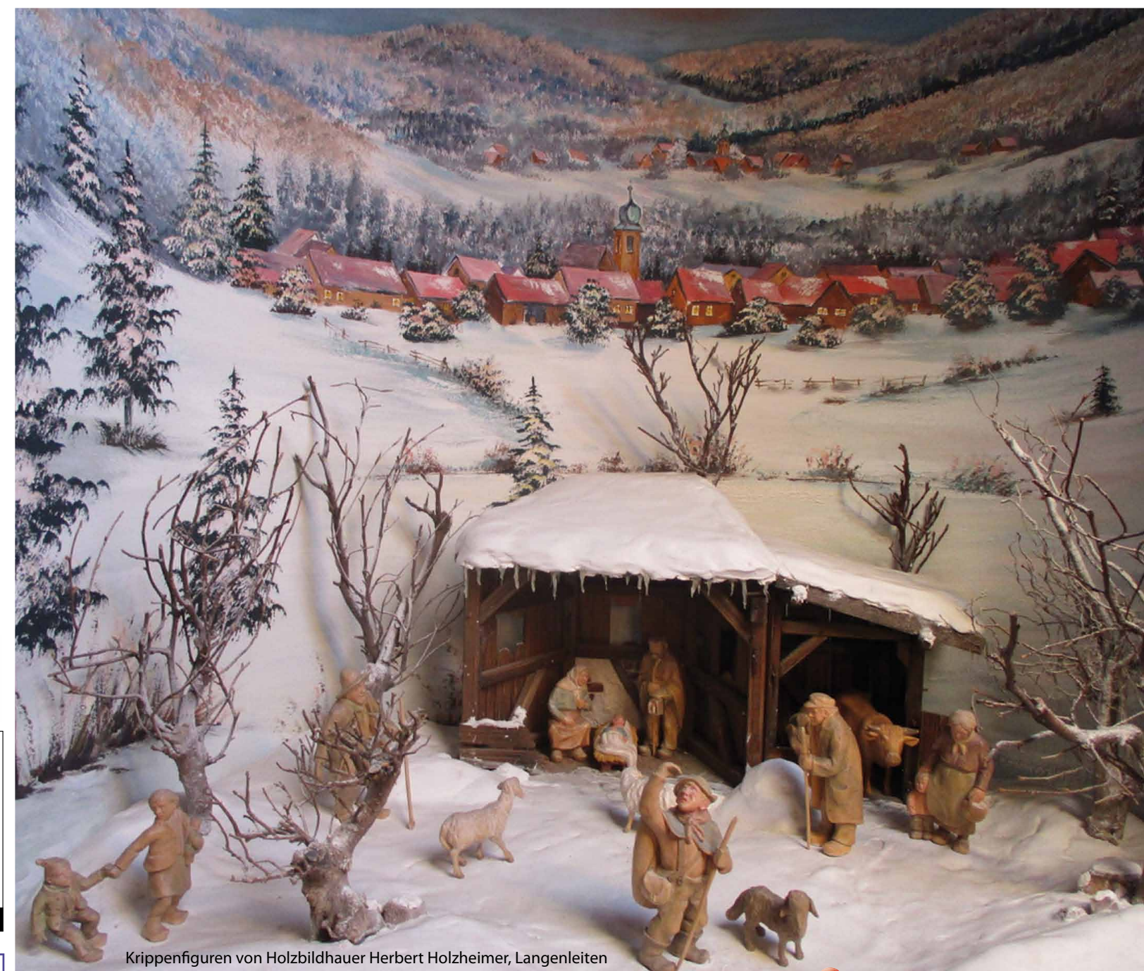
Krippenfiguren von Holzbildhauer Herbert Holzheimer, Langenleiten