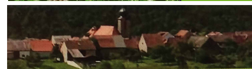
Am 15.12.2023 um 14:30 Uhr im Dorfzentrum in Waldberg